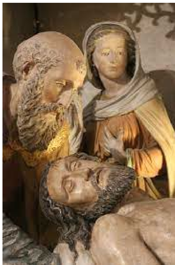
Mise au tombeau d'Amboise

La liturgie du samedi saint est celle du grand shabbat, le temps du silence, du repos et du recueillement. L'église est invitée à entrer dans ce difficile dépouillement du deuil et de la patience, en rejoignant le Très Bas aux profondeurs de la terre ! c'est l'heure du combat spirituel. Devant le tombeau scellé, le croyant est saisi par l'épreuve du doute, la traversée du désert, la tentation de s'enfermer dans la tristesse et le désespoir. Cette descente aux enfers est l'itinéraire du Christ Sauveur, pour qu'aucun ne soit perdu ! Communier à cette descente aux enfers est la plus belle des Solidarités que l'on puisse expérimenter pour laisser les premières lumières de Pâques s'infiltrer dans les moindres recoins de la Mort ! " Dans la nuit, un cri s'est fait entendre : voici l'Epoux qui vient !" Il est grand le mystère de l'Espérance.