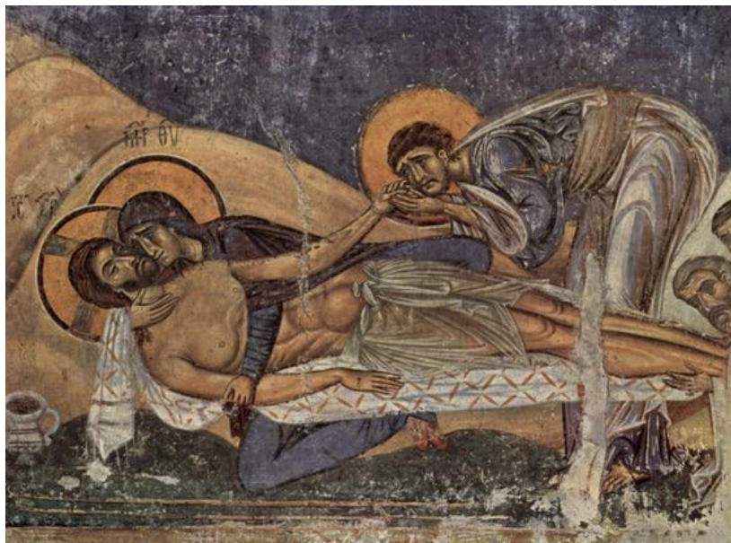
Icone de la mise au tombeau

Les chrétiens d'orient aiment à parler du « grand et saint samedi ». On ne célèbre pas l'eucharistie ce jour-là, il est dit aliturgique. On chante seulement les psaumes le matin à l'office des ténèbres, mais déjà un tressaillement se fait sentir : désir inextinguible de la vie ? Foi discrète et opiniâtre de la Vierge Marie et, par elle, de tout le peuple des croyants ? L'Éternel ne peut laisser son enfant bien-aimé au pouvoir de la mort. Poids de l'incertitude et du doute devant la mort. Souffle silencieux et puissant de l'espérance.